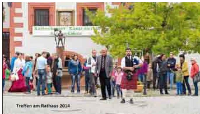
Treffen am Rathaus 2014

Traditionell beginnen wir mit dem Zug der Kinder und Ihrer Exponate vom Rathaus zur Josefskirche. Es wäre schön, wenn sich viele um 15.15 Uhr versammeln und den Weg durch die Stadt, diesmal voran mit einem Drehorgelspieler, antreten würden!