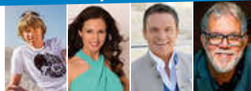
Mickie Krause, Anita Hofmann, Stefan Mross und Wolfgang Trepper